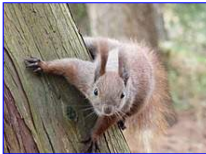
Falcibus robustis sciuri erepentes adiuvantur

Sciuri referuntur in numerum animalium plantigradorum 1 . In palmis pedum anteriorum habent quattuor digitos longos, valdê mobiles, qui instructi sunt falcibus longis incurvis; pollicibus imminutis adhaeret exigua particula unguiculi. Pedes posteriores perlongi sunt et valdê robusti. Falcibus longis et incurvis sciuri etiamsi praecipites celeriter erêpunt ad stipites laeves, tamen non decidunt.