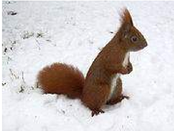
Ecce sciurus pelle hiemali indutus.

In terrâ continenti europaeâ sciuri saepe sunt albinismo atque melanismo insignes.