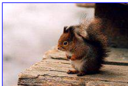
Ecce sciurulus nonnullas tantum septimanas natus