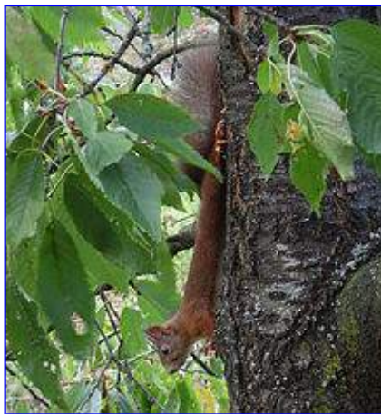
Sciurus praeceps de arbore nitens