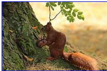
Sciurus catulum manibus tenens

Sciuri vitam agunt diurnam. Hae bestiolae habilissimê in arbores connituntur seque pulsatim promovent, eius motiones fiunt rapidê et accuratissimê sive connititur in stipitem arboris sive in parietem domûs exteriorum asperum sive sursum sive praeceps deorsum. Si deorsum nituntur, brancas posteriores torquent extrorsum et retro. Uno tantum saltu salire possunt per distantiam quattuor vel quinque metrorum. Sciuri propter pondus suum parvum audent etiam salire in ramos valdê tenues; semper salientes se promoventes superant omnem persecutorem. Etiam humi se movent saltibus, non gradu citato ut alia quadrupeda, quo ibi facile fit, ut corripiantur a canibus aut cattis, in viis etiam possint obteri autocinetis. Etiam etiamque saepius spectantur sciuri cultûs civilis humani secutores etiam niti in domorum parietes exteriores, si quidem parietibus insunt aliquae proiectorum, et in maenianis et xystis tectorum ab hominibus cibari aut ipsi nutrimenta quaerere, velut grana domunculae aviariae. Ad dormiendum et quiescendum sciuri construunt nidos sive cubilia, quae theodiscê appellantur Kobel .