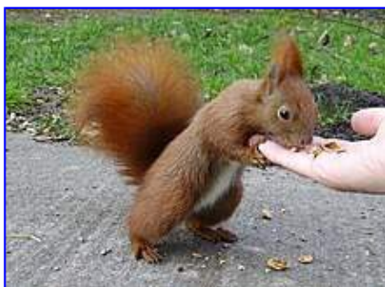
Ecce sciurus cicuratus!

Hieme penora saepe sunt unica sciurorum nutrimenta. Si sciurus penora obruta obliviscitur, semina vernali tempore germinant. Itaque sciuri dicuntur multum valere ad silvam renovandam. Ad penora autumnno collecta redinvenienda maximê valet sciuri sensus olfactorius. Etiam si sciuri nonnulla penora suffossa recordantur, tamen non possunt omnes latebras memoriae suae imprimere.