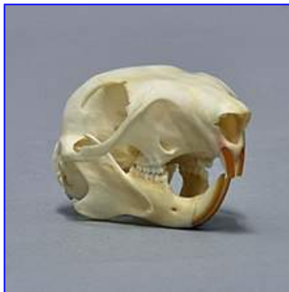
Cranium sciuri (Collectio Musei Visbadensis)

Cranium sciuri est lata, plana, rotundata, cranio cerebriali ôviformi, rostro brevi, angusto, alto. Cranium Sciuri vulgaris minus est quam cranium Sciuri carolinensis , cranium cerebrale est altius, processûs postorbitales sunt longiores et angustiores, et frons anterior inter cava oculorum paululum impressa. A Sciuro anomalo vulgaris differt etiam cranio cerebriali altiore et rostro longiore, longo margine inferiore arcûs zygomatici, qui e maxillâ exoritur loco medio posterioris dentis superioris praemolaris, et maioribus bullis tympanicis, quae duobus dissepimentis sunt instructae loco trium. Contra ac Sciuro anomalo latitudo rami mandibulae in mediâ parte est maior quam longitudo ordinis dentium