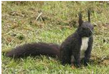
Color pellis est obscurê-fuscus.

medius 5,9mm), in ventre 13-13mm (valor medius 16,4 mm), in dorso 17-23mm (valor medius 22,5mm). In basi capilli sunt diametro 0,04 mm, in regione aristae diameter est summum 0,12 mm. Pili lanei sunt variae longitudinis, undulati vel spirales. Eorum diameter est 0,010–0,015mm. Qui versus aristam versusque bulbum acuminantur. Capilli aurium adulti penicillei sunt 3–5cm longi, pili caudales 5–8cm longi, interdum etiam summum 10cm longi. - Color pellis superioris variatur a lucidê-rubro usque fusco-nigrum; latus ventrale est a pelle dorsali clarê distinctum, albi aut cremei coloris. Pellis sciuri hiemalis multo densior est quam aestiva. Hieme color pellis saepe fit obscurior, interdum etiam griseus. Sciuri si sunt pelle hiemali induti penicillos aurium habent coloris rubro-fusci, longitudinis summum 3,5 cm. Si sciurus gerit pellem aestivam, hi penicilli aurium sunt parvi aut desunt. Hieme praeterea etiam plantae pedum, quae alioquin sunt nudaae, sunt pilosae.