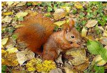
Autumnalis pellis penicillis aurium instructa.