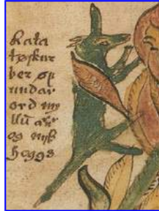
Ecce sciurus Ratatöskr in Yggdrasil fraxinum mundi erepens. Imaguncula codicis islandici saeculi 17.i

Cum Graeci putaverint sciurum posse caudâ suâ ingenti ipsos sibi umbram facere, ei nomen indiderunt, q.e. σκιοῦρος, i.e. cauda umbrae .