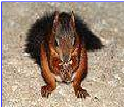
En sciurum nucem vorantem!

Nutritio. Sciuri sunt bestiae omnivorae. Nutrimenta eorum pro tempore anni variantur. Quae sunt imprimis bacae, nuces alique fructûs necnon semina. Praeterea etiam gemmae, cortex, sucus arborum, flores, lichenes, grana, fungi, poma necnon animalcula invertebrata, velut vermes. Etiam ova et pulli avium et insecta, larvae, cochleae a sciuro non respuuntur. Sciurus cibum vorans solet manibus tenêre anterioribus. - Sciuri in die consumunt summum 100 conos pinuum; per medium cottidie 80-100g. Sciuri conos pinuum eo aliter deglubunt quam aliae bestiae rosoriae, quod squamas conorum tectorias, quo sunt robore corporis magno, prorsus abripiunt. E contra mures hoc non possunt, sed squamas mordendo absecant, ut accipiant semina nutritibilia. Sciuri avellanas atque iuglandes aperiunt intra paucas secundas. Dentibus incisoriis inferioribus scabentes primo rodendo nucem perforant. Si foramen est sat magnum, inferiores dentes incisorios tamquam vecticulum adhibentes partem putaminis expulsant. Haec consuetudo didicerunt; iis non est nativa. Sciuri extra nutrimenta comesa egent aquâ additiâ.