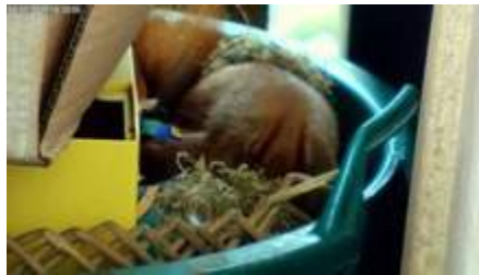
Mater tres catulos mammas