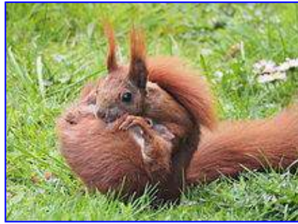
Sciurus catulum transportat formâ corporis rigidâ