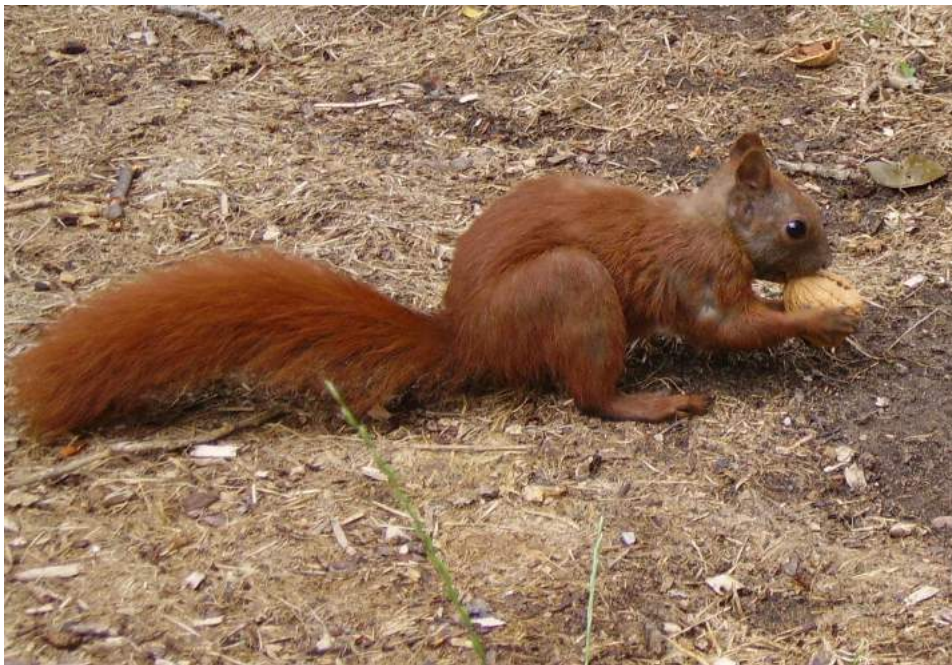
Sciurus pelle aestivâ indutus